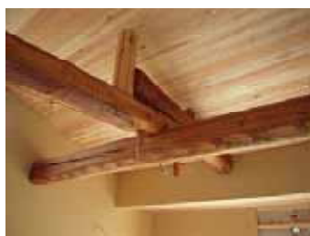
【IN富山市八尾 改修工事】