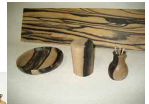
—趣味の手作り工芸品—