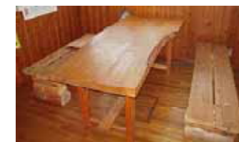
このダイニングテーブルはもうすぐ引渡しの中保の家にお嫁にいきます。