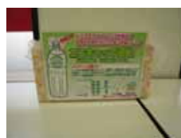
こんな感じで袋詰めのところにおいであります。