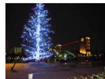
【富岩運河環水公園】