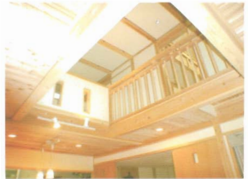
子供達の笑顔に入りキャットウォーク。