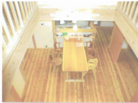
会話のほずむダイニング