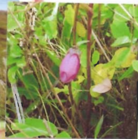
長野県霧ヶ峰八島ヶ原 湿原。