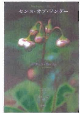
「センス・オブ・ワンダー」 レイチェル・カーソン 新潮社 ¥1400-

この本は、彼女の最後の本なのですが、地球の美しさを感じるのも、探求するのも、守るのも、そして破壊するのも人間なのだから、ということも、教えてくれます。