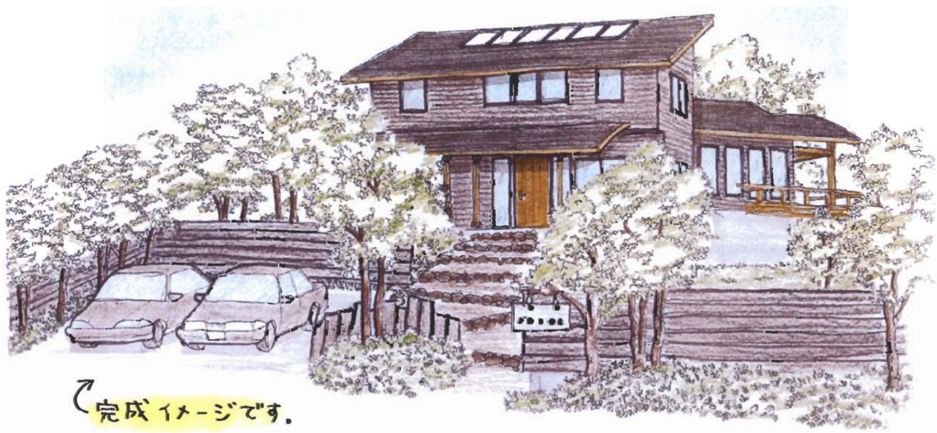
完成イメージです。