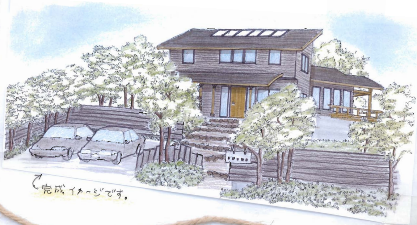
完成イメージです。